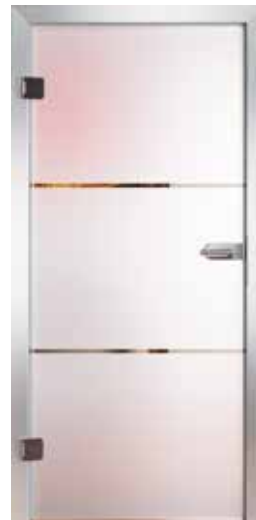
3257 „Unit III“