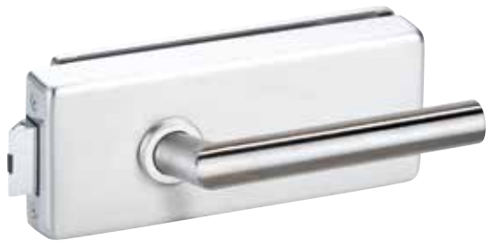
818 EE Oberfläche: Edelstahl