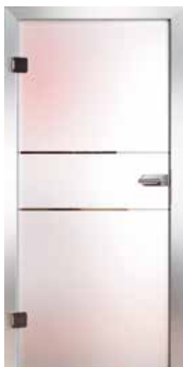
3221 „Unit I“