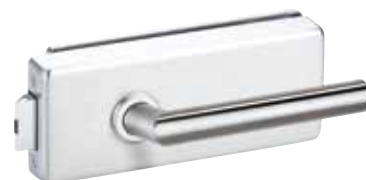
818 EE Oberfläche: Edelstahl