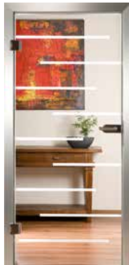
3083 „Stripes II“