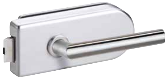
418 EE Oberfläche: Edelstahl

Diese ausgewählten Modelle aus unserer loft Glastürenkollektion erhalten Sie in den Größen 709 / 834 / 959 x 1972 mm inklusive Beschlag innerhalb von nur 3 bis 5 Tagen.