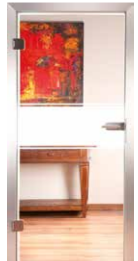
3222 „Unit II“