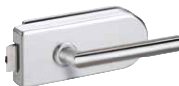
418 EE Oberfläche: Edelstahl

Lieferbare Größen: 709/834/959 x 1972 mm Inklusive Beschlag innerhalb von nur 3 bis 5 Tagen erhältlich